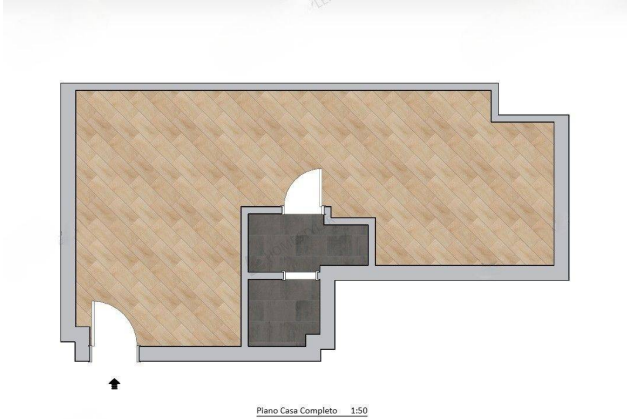
Piano Casa Completo 1:50