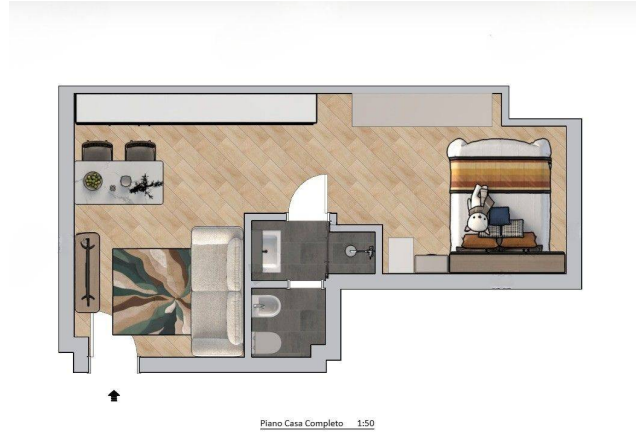
Piano Casa Completo 1:50